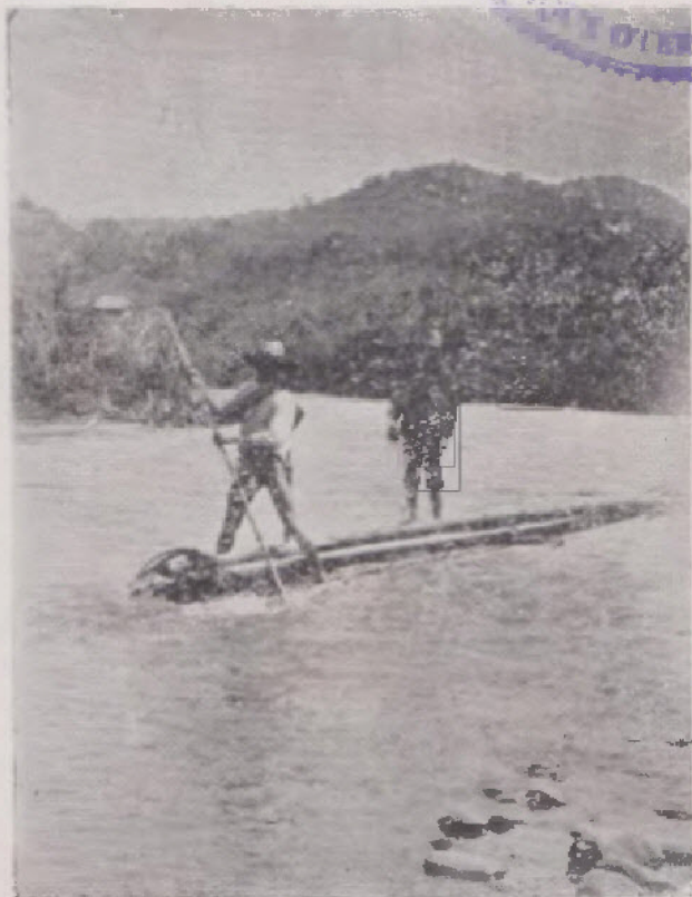
Una balsa en el río Bugalagrande (El Peñón), El Bugalagrande riopá los distritos de su nombre, San Vicente y Tulua.

El valle de Barragán podrá ser con el correr del tiempo asiento de ciudades por su ventajosa situación geográfica y por las innúmeras riquezas naturales que guarda.