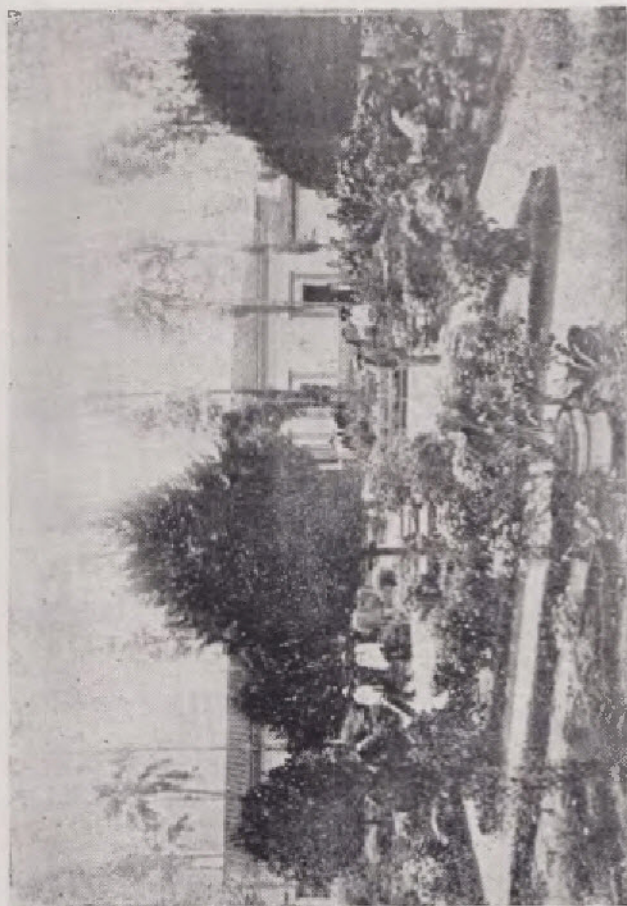
El Parque Céspedes aledaño al río Tuluá estaba en proyecto en 1907. El grabado representa el esfuerzo hecho para inaugurar el día 20 de Julio con motivo del Centenario

En este año se otorgaron ante el Notario Público 337 instrumentos por valor de $ 110.204,81 oro.