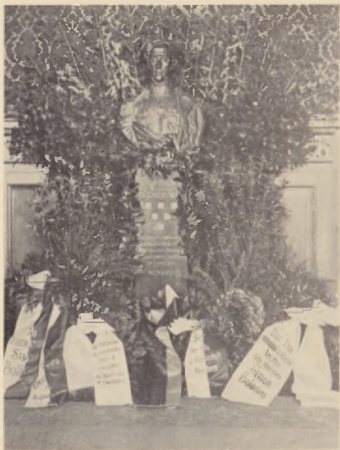
El monumento al Libertador en el Palacio de Gobierno de Hamburgo, después de tributado el homenaje a su memoria el día 17 de Diciembre.