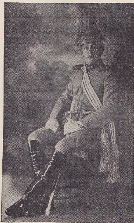
Retrato del Autor en 1936